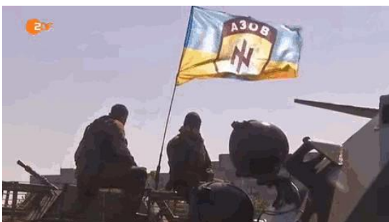
A kép a ZDF televízió 2014. szeptember 8-i, 18 perces tudósításából való

Elsősorban éppen az a fenyegetés váltotta ki a konfliktust, hogy – az ukrainai többség és akkori választott kormánya ellenzése ellenére – Ukrajnát egy Oroszországgal szemben ellenséges katonai szövetségbe akarták bevonni. A béke fenntartása helyett a NATO maga az oka a feszültség és a háború fokozódásának. Mindig így volt ez amióta a NATO-t 1949-ben, a hidegháború tetőpontján, hat évvel a Varsói szerződés előtt megalapították, állítólagos védelmi szerződés-ként a szovjet fenyegetés ellen. Gyakran állítják, hogy ez a szövetség tartotta fenn 40 éven át Európában a